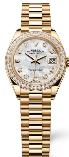
OYSTER PERPETUAL LADY-DATEJUST